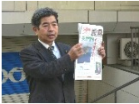
「公明党議員は日本の領土堂々と主張を」と訴え、宣伝写真 は本八幡駅北口

「しっかり発言、きちんと報告」します。市政に関する、ご意見・ご要望をお聞かせ下さい。メールアドレス kyousankaneko@yahoo.co.jp