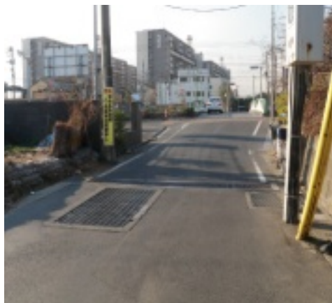
大柏川、山之下橋で事故が起きました。安全対策として、側道に「止まれ」の標識を設置するか、または車止めするなど検討して下さい。