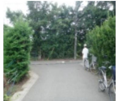
宮久保4丁目15番地先のベルクス横T字路にミラーを設置して下さい。