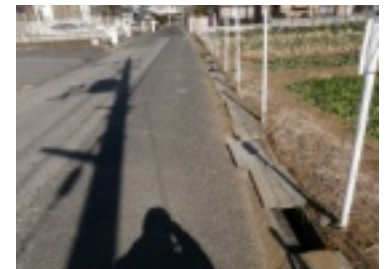
曾谷2丁目壊れた側溝の整備を要望。他にも3カ所要望を提出しました。