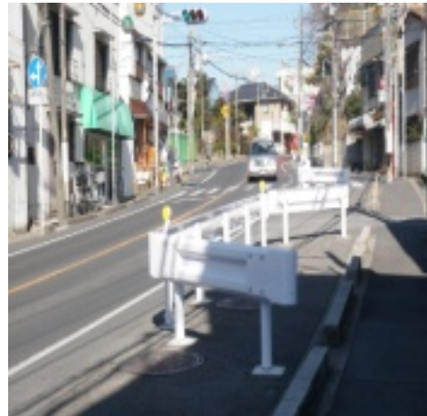
宮久保1-36番地、ガードレールが設置されたため、事故が発生しています。安全対策を検討して下さい。

日本共産党市議団が行った「市政アンケート」に地域の具体的な要望が多く寄せられました。市議団は現地を調査し、2月3日、市長に22項目の改善要望書を提出しました。下記の写真はその一部です。