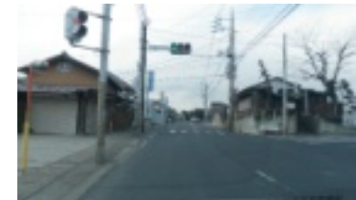
柏井町の交差点の横断歩道が消えています。補修して下さい。