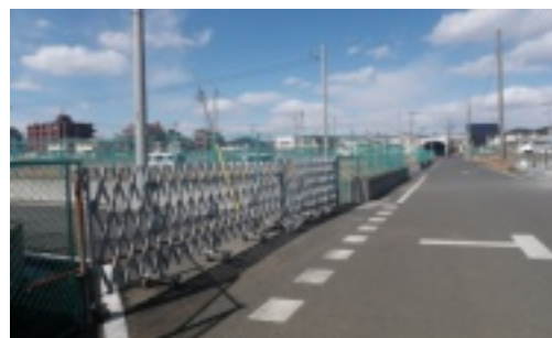
空き地のままの外環代替地(曾谷6丁目)

市川の特養待機者ゼロの会は、「曾谷6丁目外環代替地に特養ホーム・保育園の建設を、