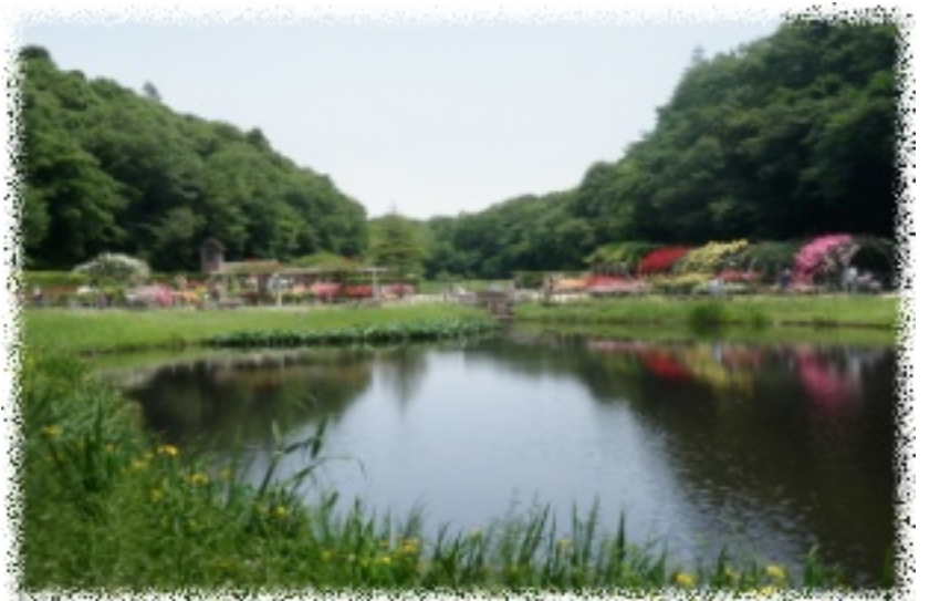
大町公園の谷津、貴重な自然が残されている。若葉で覆われた遊歩道を散策していると、心から癒される。池にはカワセミもやって来るのでカメラマンが待ち構えていた。(5月25日)