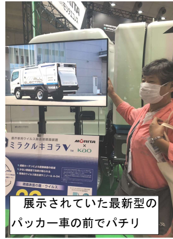
展示されていた最新型のパッカー車の前でパチリ

の資源化、生ごみの減量・資源化の展示が多いと感じました。企業で開発された機器や取り組みが進んでいる自治体もブースを借りて展示をしていました。