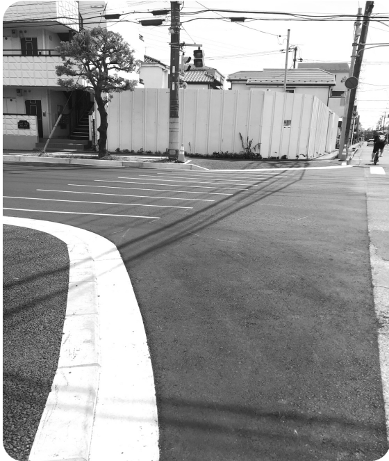
場所は、バイパスと国道357を結ぶ通称「ガーデナーアベニュー」のほぼ中央。