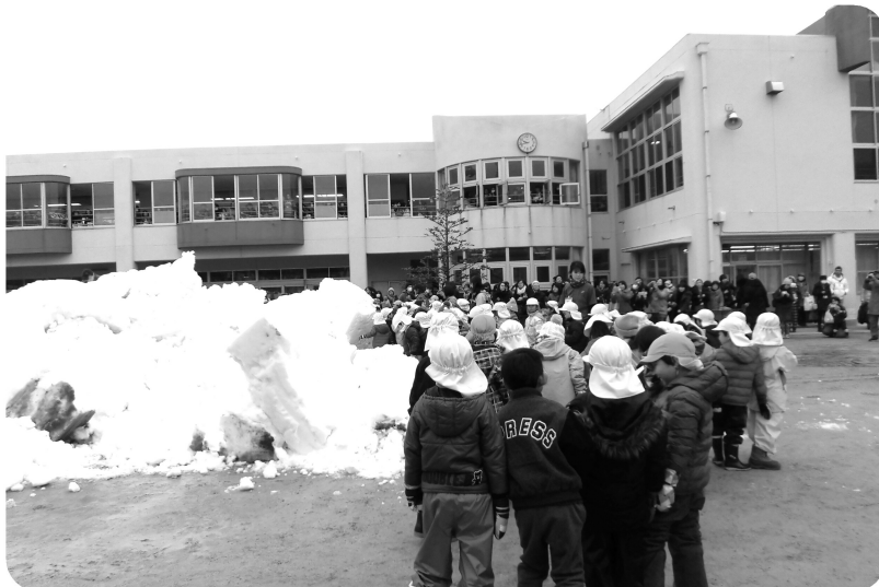
1月27日、地域方のご厚意で、塩焼幼稚園にトラック8台分の雪が届けられました。完全防備の園児たちは大はしゃぎでした。