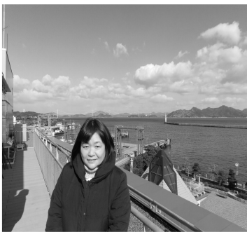
今治市みなと交流センターにて

型フェリーが停泊できる大きな港で、2015年にできたばかりの「みなと交流センター」は、市民が憩える場所の提供になっています。