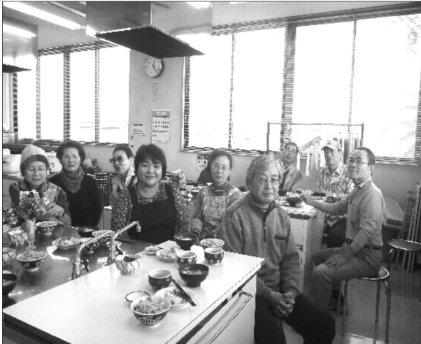
廣田地域のキラキラ会は11月15日、手作りランチをみんなで食べながら、県政・市政の話も交え、つどいをおこないました。

私も行きます、ご一緒しましょう。塩浜・南行徳・行徳～バスが出ます、詳細はお尋ねください。