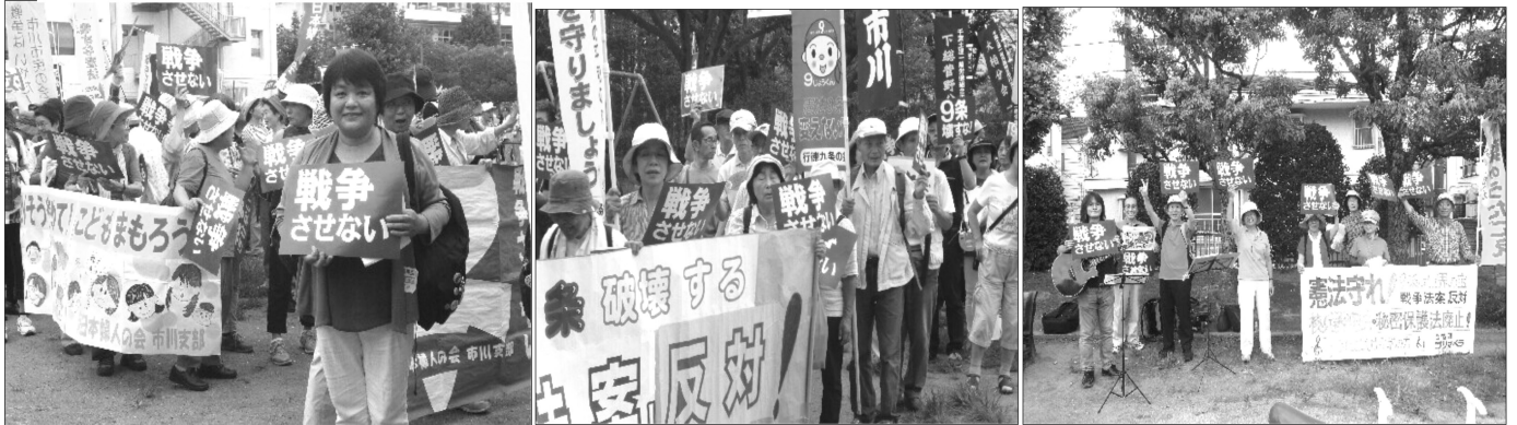
写真左から、デモ行進出発前、行徳9条の会のみなさん、合唱団プリマベラのみなさん 550名を超える参加で大洲公園での集会の後、市川駅まで元気にパレードしました。