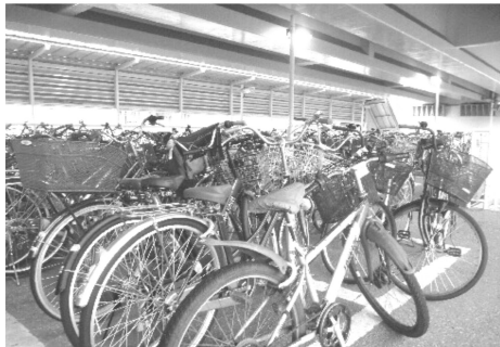
南行徳第1はいつでも満車

「受益者負担の適正化とサービスに応じた使用料」と「民間活力の活用」を基本方針としていますが、市民サービスを民間に丸投げして、かかる費用は利用者負担という考え方しか見えてきません。