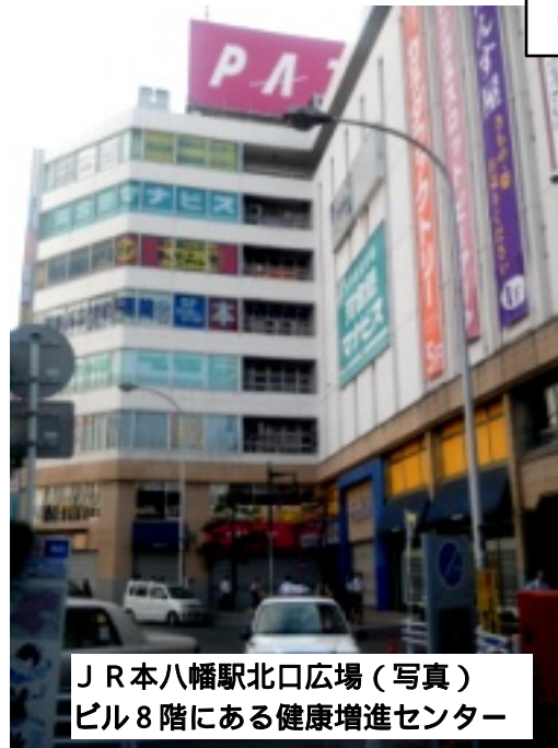
JR本八幡駅北口広場（写真） ビル8階にある健康増進センター