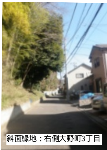
斜面緑地：右側大野町3丁目