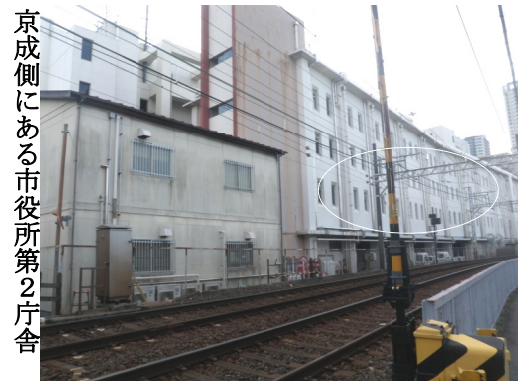
京成側にある市役所第2庁舎

10月の全員協議会、私の質問に市は答弁し、庁舎整備基本構想も修正しました。党市議団は引き続き、第1庁舎の耐震診断実施や暫定補強を求め、市民への徹底した情報公開を要求していきます。