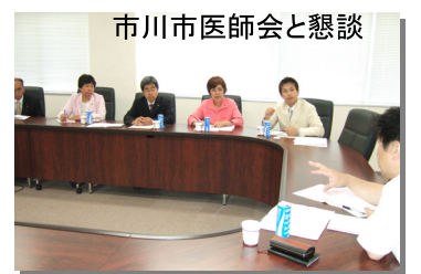
市川市医師会と懇談

浦安市川市民病院後継の「東京ベイ浦安市川医療センター」は、地域になくってはならない救急・産婦人科・小児科・高齢者医療の充実をと訴えてきました。一年後に新病院が完成します。ひきつづき、地域医療充実に取り組みます。