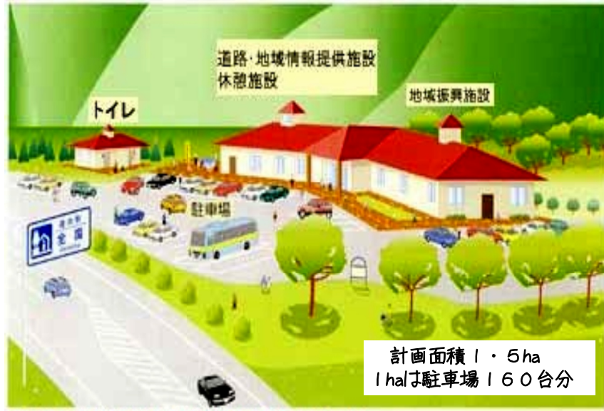
上記イラストは国土交通省道路局ホームページ

( http://www.mlit.go.jp/road/station/road-station_inst.html ) から引用