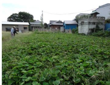
芋掘り体験できる畑(宮久保)